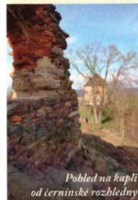
Pohled na kapli od černínského rozhledny

Výhlídka na vrchu Věch svatých je celoročně volně přístupná. Kaple je otevřena každou sobotu a neděli od dubna do září, od 14 do 16 hodin.