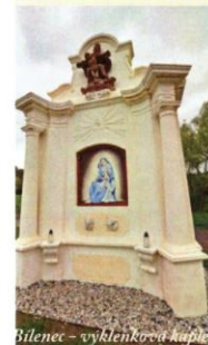
Bilenec - vyklenková kaple