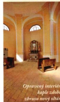
Opravený interiér kaple zdobí zbrusu nový oltář