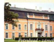
Petrohrad - zámek