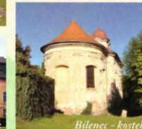
Bilenec - kostel